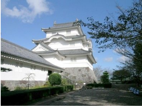
千葉県立中央博物館 大多喜城分館

『ふれんどリーフ』もおかげ様で、第10号を発行する事が出来ました。 これも、皆様のご協力があつてのことと深く感謝しております。