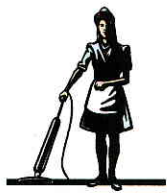
スカパー東京メディア センター 秋 山 幸 江