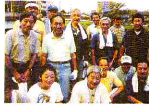
綾瀬川左岸の八日市場から手代橋まで清掃を行いました。草加中央店エリアの住民たち